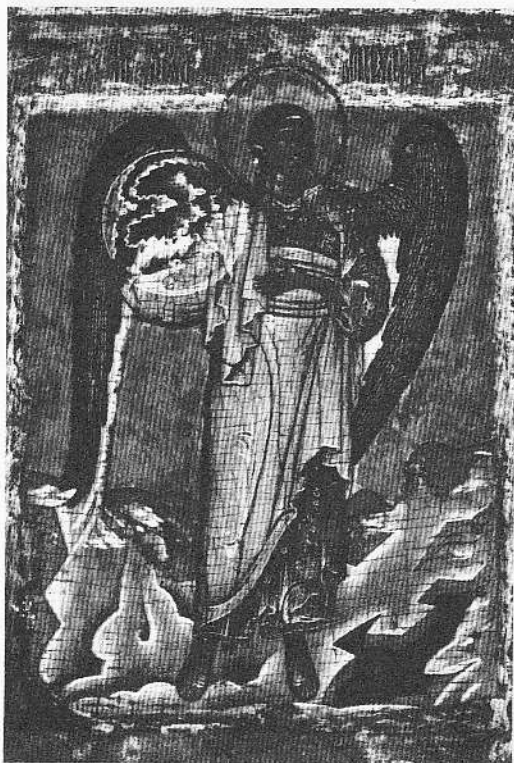
Iconne de la Couverture : L'ARCHANGE SAINT MICHEL.